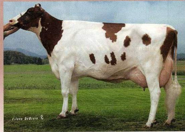
Ms Louisiana-Red EX-2E è la sorella piena di Lava-Red e dei tori provati Malvoy-Red e Landslide-Red.