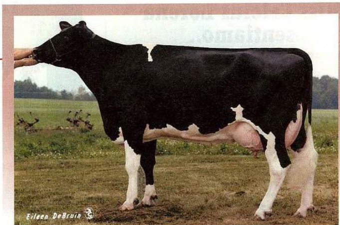
Miss Celcius Lorena RC EX-92 è figlia di una sorella di Leadman.