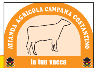
Art. BAC 02/C

PERSONALIZZA IL TUO CARTELLO CON L'IMMAGINE DELLA TUA VACCA!