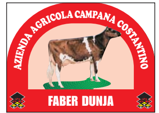
Art. BAC 02/B