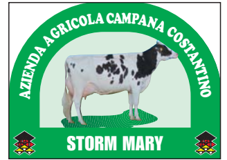
Art. BAC 02/A